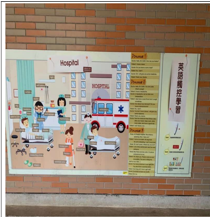
校園教具營造-英語觸控學習