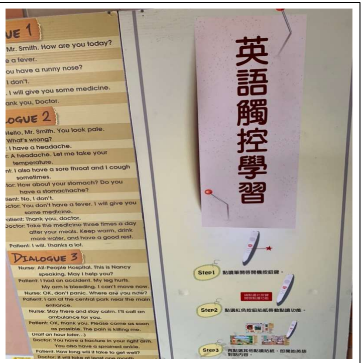
校園教具營造-英語觸控學習