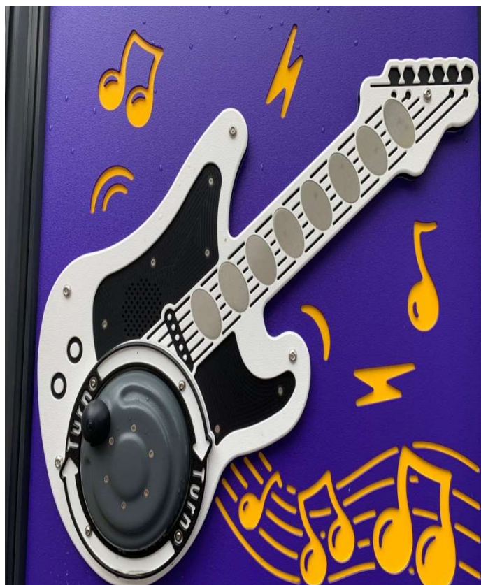
校園教具營造-吉他聲音互動器