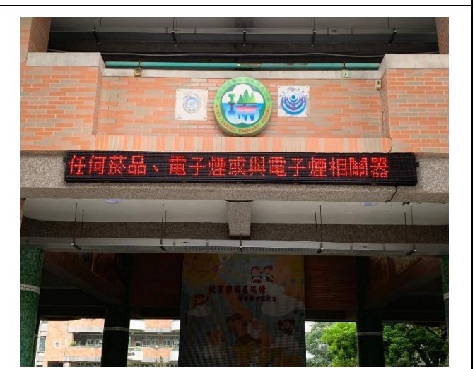
說明:無菸校園宣導