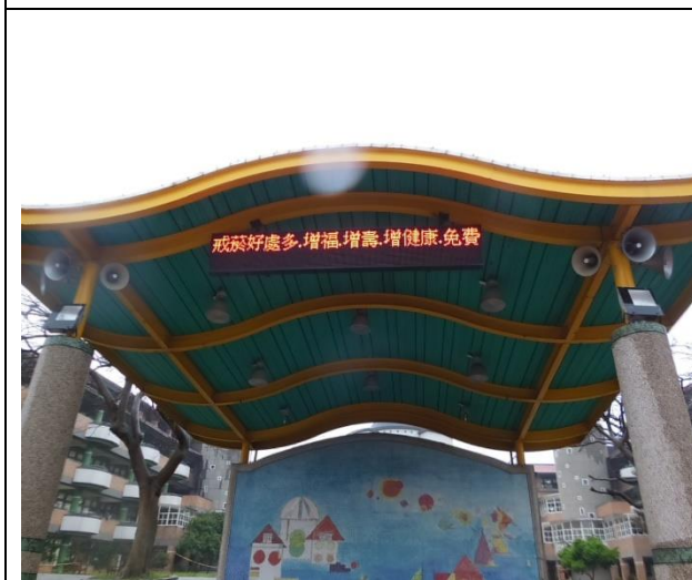
說明:無菸校園宣導