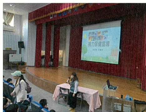
說明：視力保健宣導