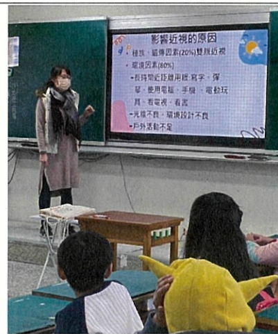
說明：視力保健入班宣導