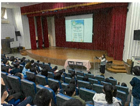
說明：視力保健宣導