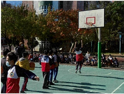
說明：五年級體育季-定點投籃