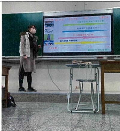
說明：視力保健入班宣導