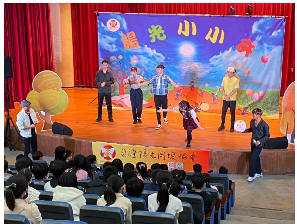
說明: 菸酒檳榔教育講座