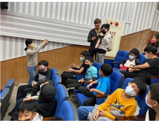
說明:學生積極參講座活動