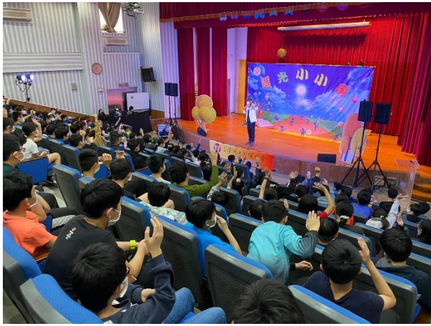
說明:菸酒檳榔教育講座