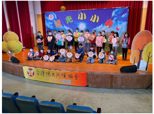
說明: 菸酒檳榔教育講座