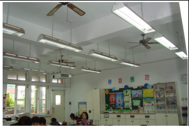
說明: 教室採光好視力跟著好!