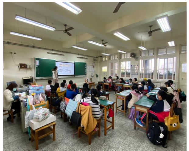
說明: 五年七班近視率