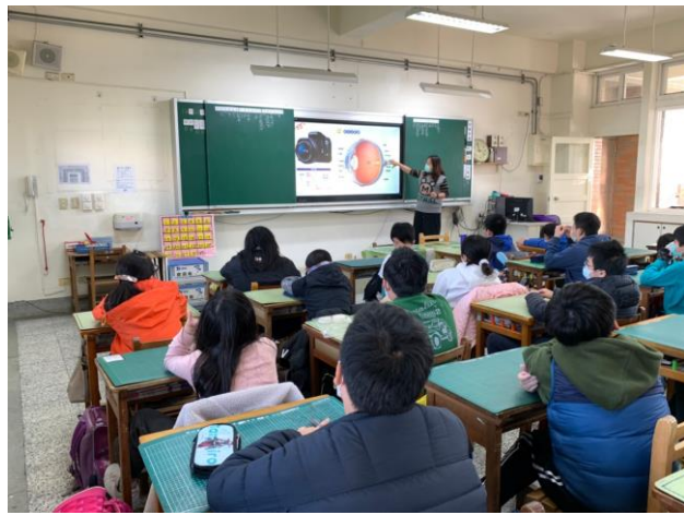
說明:宣導視力保健的重要性