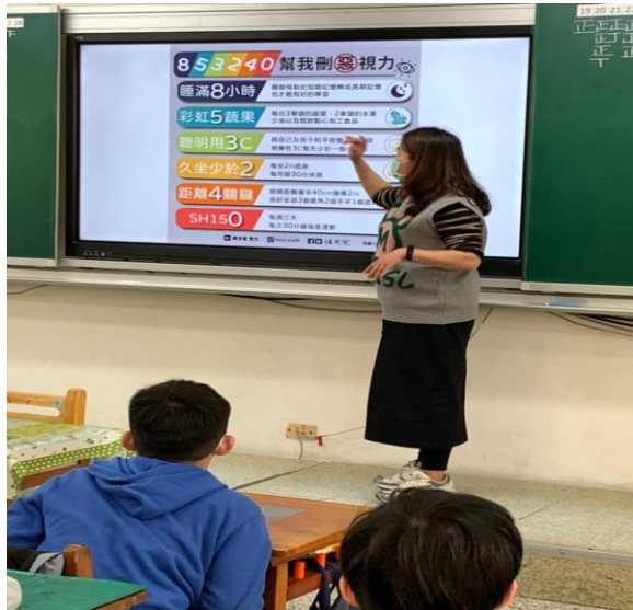
說明:幫我刪除惡視力