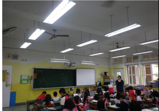
說明: 教室採光好視力跟著好!