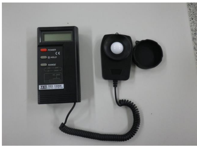
說明: 教式採光照度計