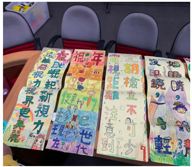
說明:視力保健海報比賽