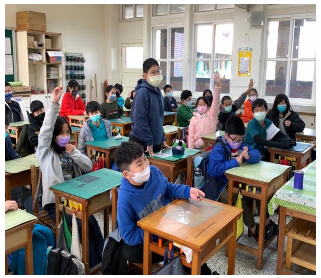
說明:提出問題並踴躍發言