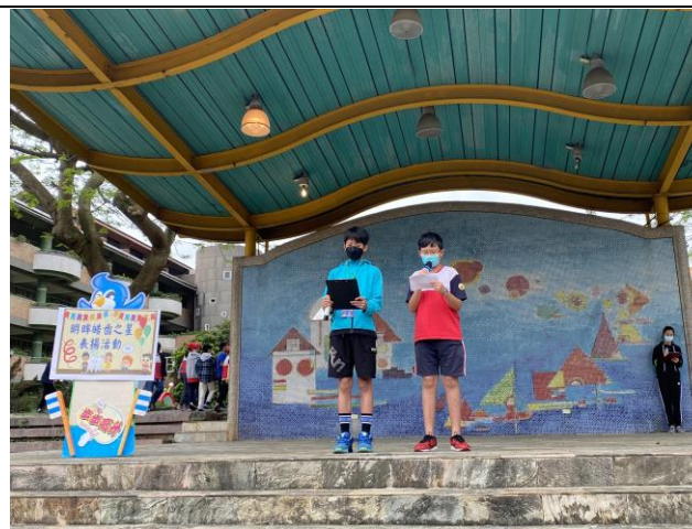
說明：平時多保健得獎就是我