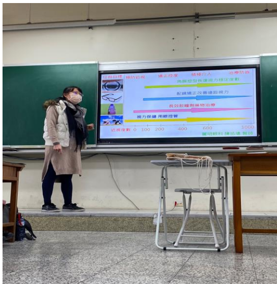
說明:近視的矯正與治療