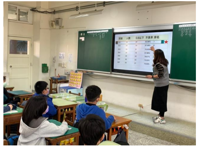
說明:六年一班近視率