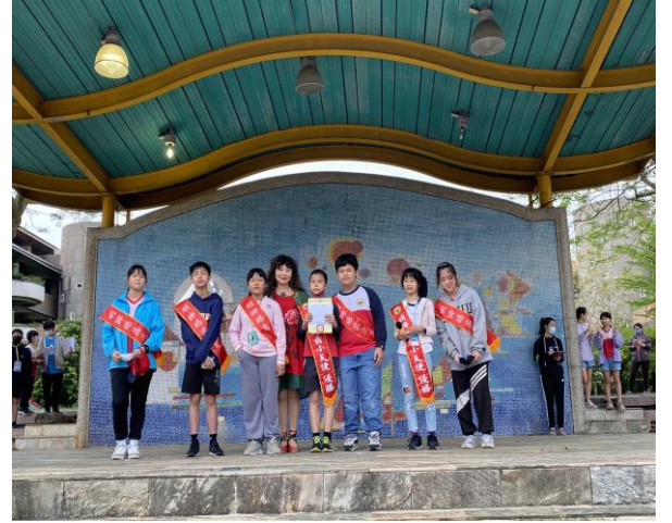
說明：六年級明眸皓齒特優頒獎