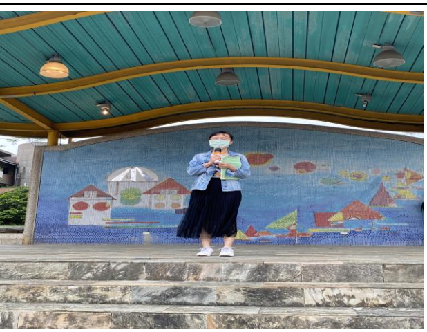
說明：護理師向全校宣導視力口腔保健