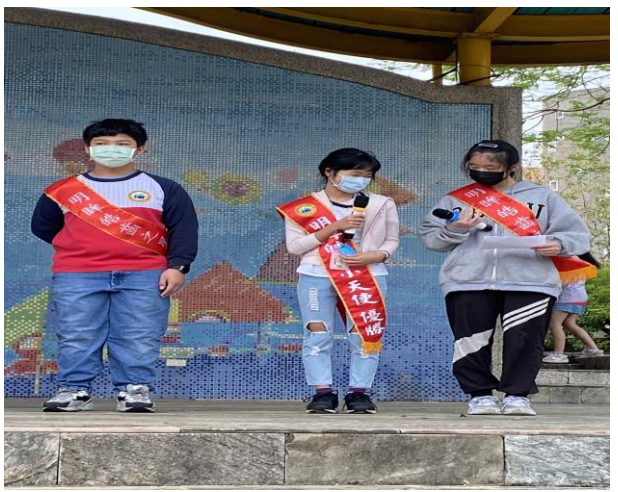
說明：如何保養視力跟牙齒經驗分享