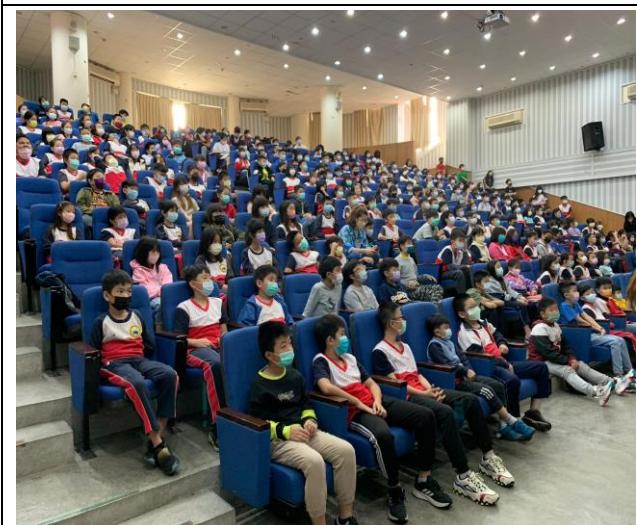
說明:學生認真聽講