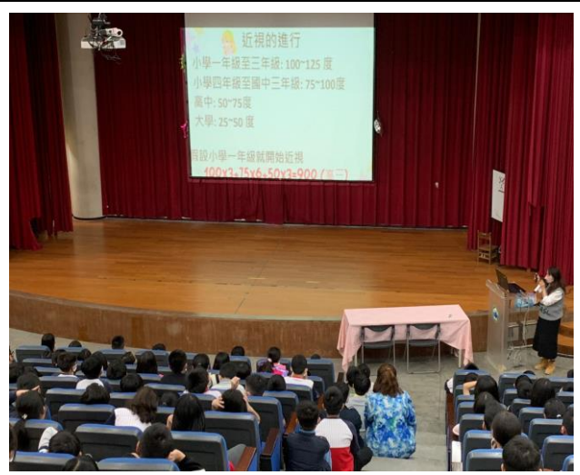
說明:視力保健宣導-近視的進行!