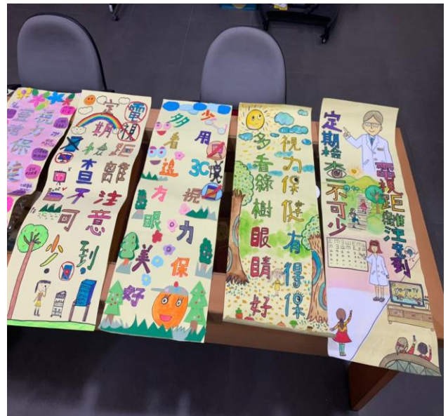
說明:視力保健標語、小口訣