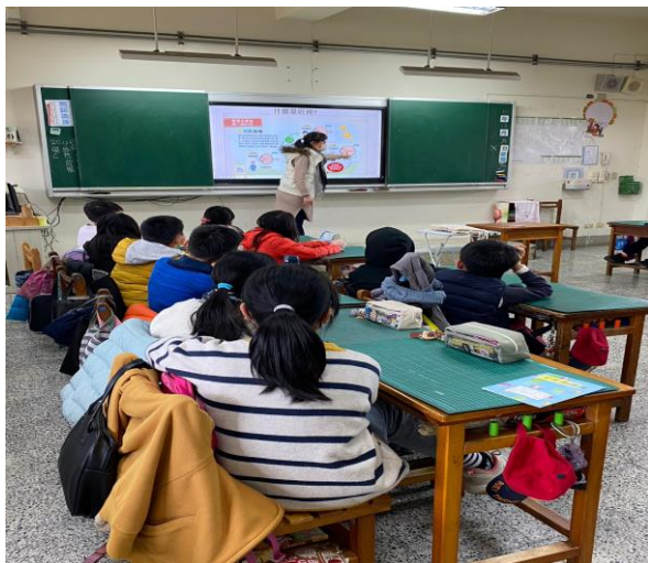
說明:甚麼是近視散光