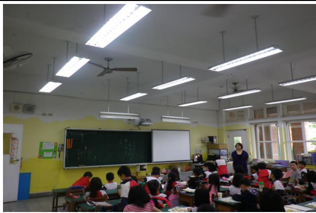
說明: 教室採光好視力跟著好!