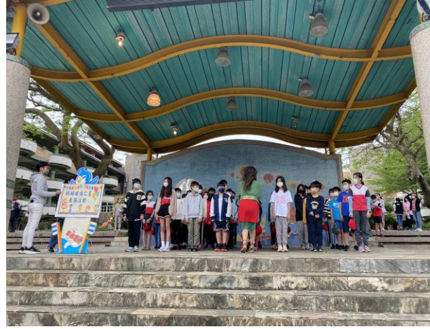
說明：五、六年級明眸皓齒之星獲獎