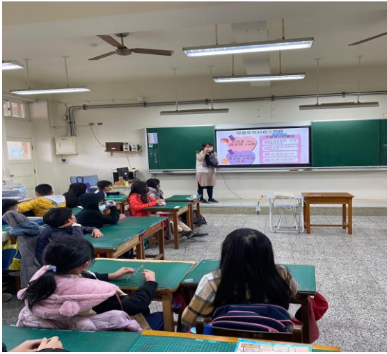
說明:宣導視力保健的重要性