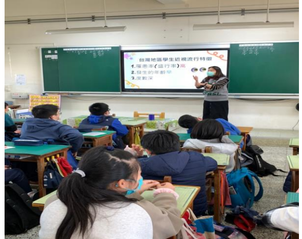
說明:視力健康才能看美麗新世界