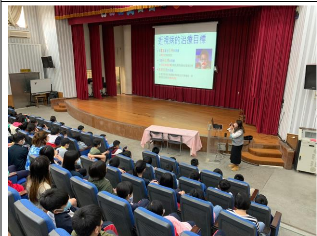
說明: 視力保健宣導