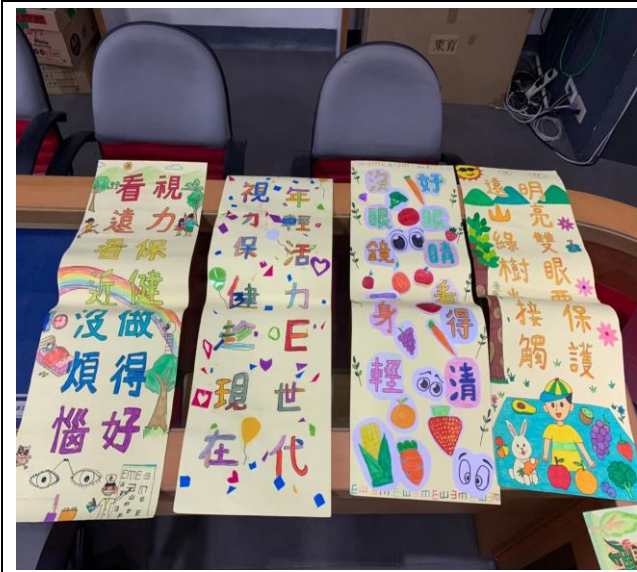
說明:視力保健創意標語