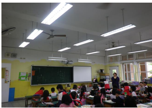
說明: 教室採光好視力跟著好!