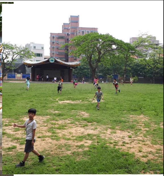
說明: 下課盡情接觸大自然