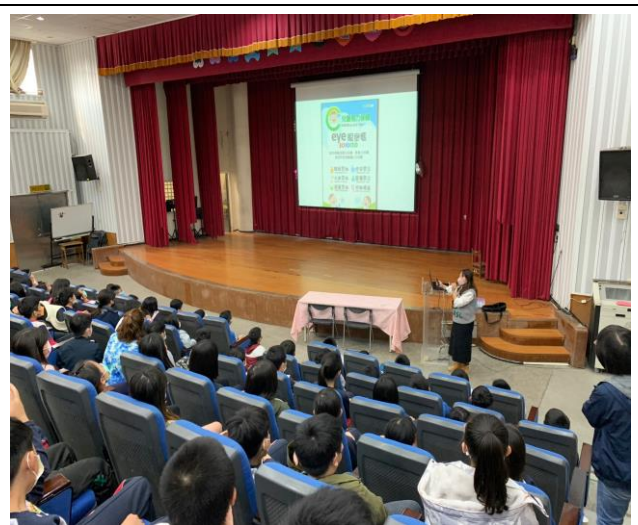
說明: 視力保健宣導-EYE 眼密碼!