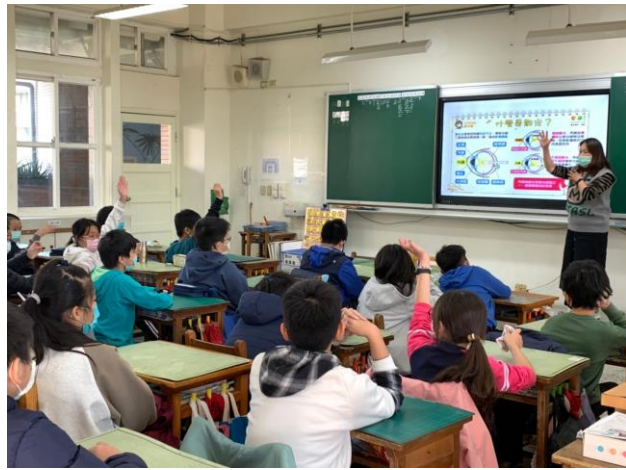
說明:甚麼是近視散光