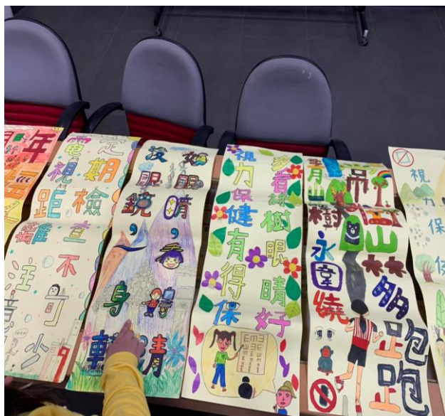
說明: 視力保健比賽海報