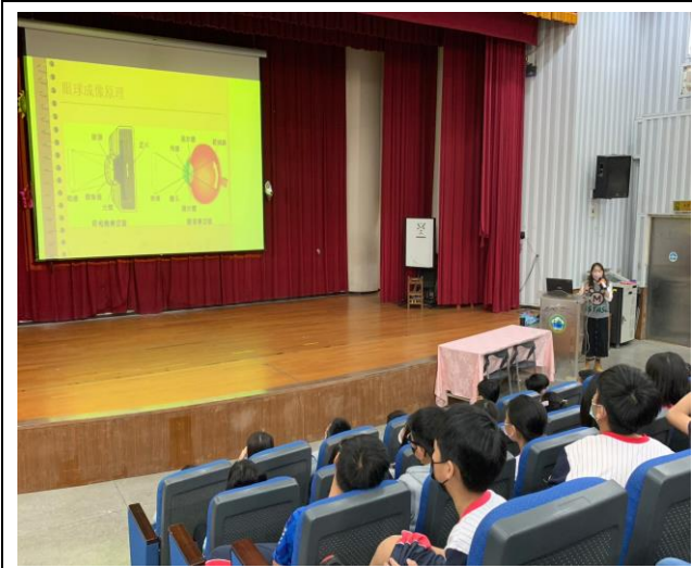
說明:視力保健宣導