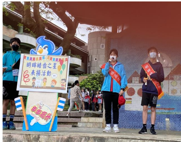
說明：明眸皓齒之星特優-心得分享