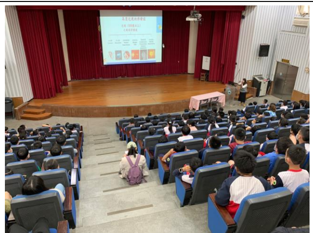
說明: 認識高度近視