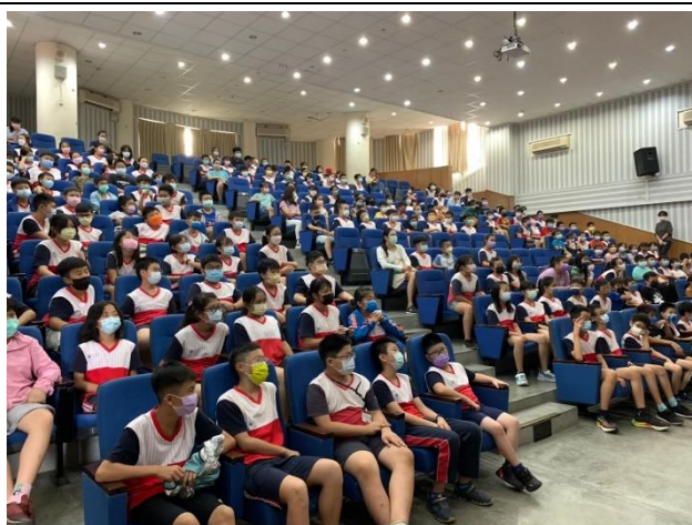
正確用藥宣導-學員認真聽講