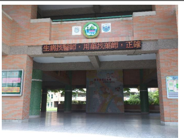
跑馬燈宣導-正確用藥