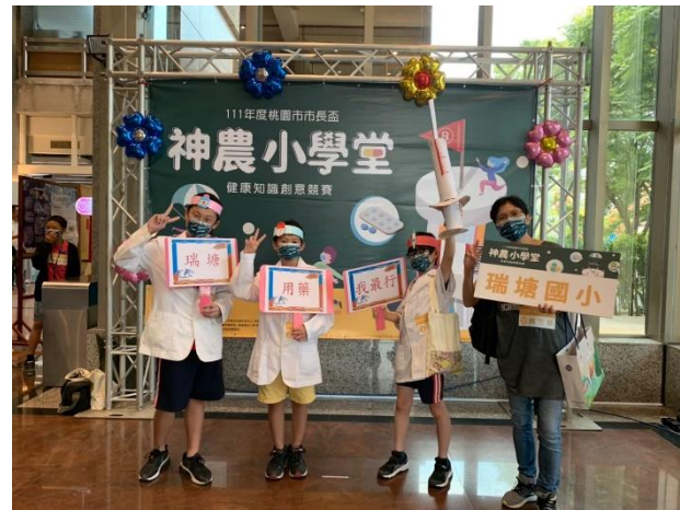
6. 參加學員開心合照