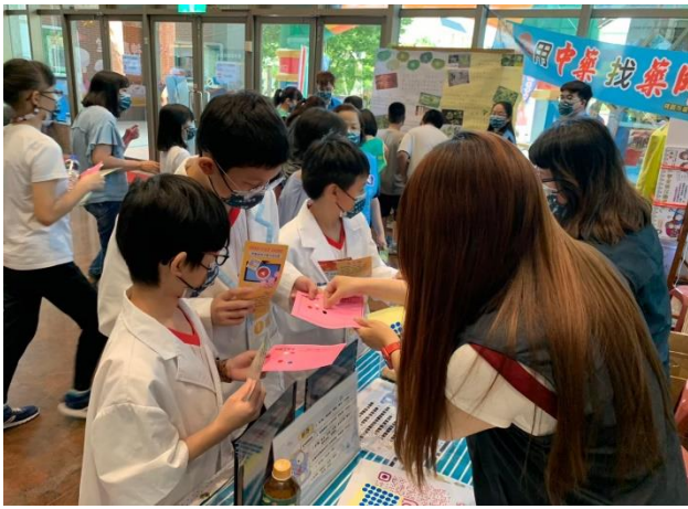
3. 參加現場的用藥知識活動