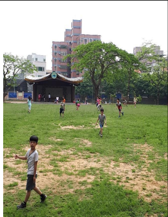
說明: 下課盡情接觸大自然