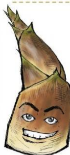
烏殼綠竹筍 產季：3月到10月