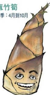
麻竹筍 產季：4月到10月