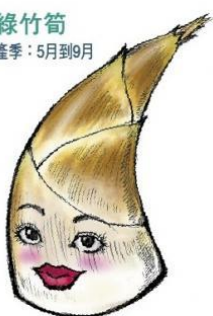
綠竹筍 產季：5月到9月