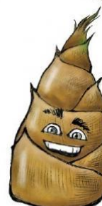
孟宗筍 產季：11月到隔年4月