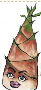
甜龍筍 產季：4月到10月